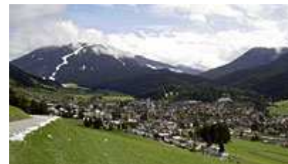
Innichen mit dem Helm im Hintergrund Aufn. v. 28.9.07, wpz