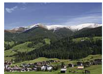
Blick auf den Helm und Hahnspiel von Sexten-Moos aus